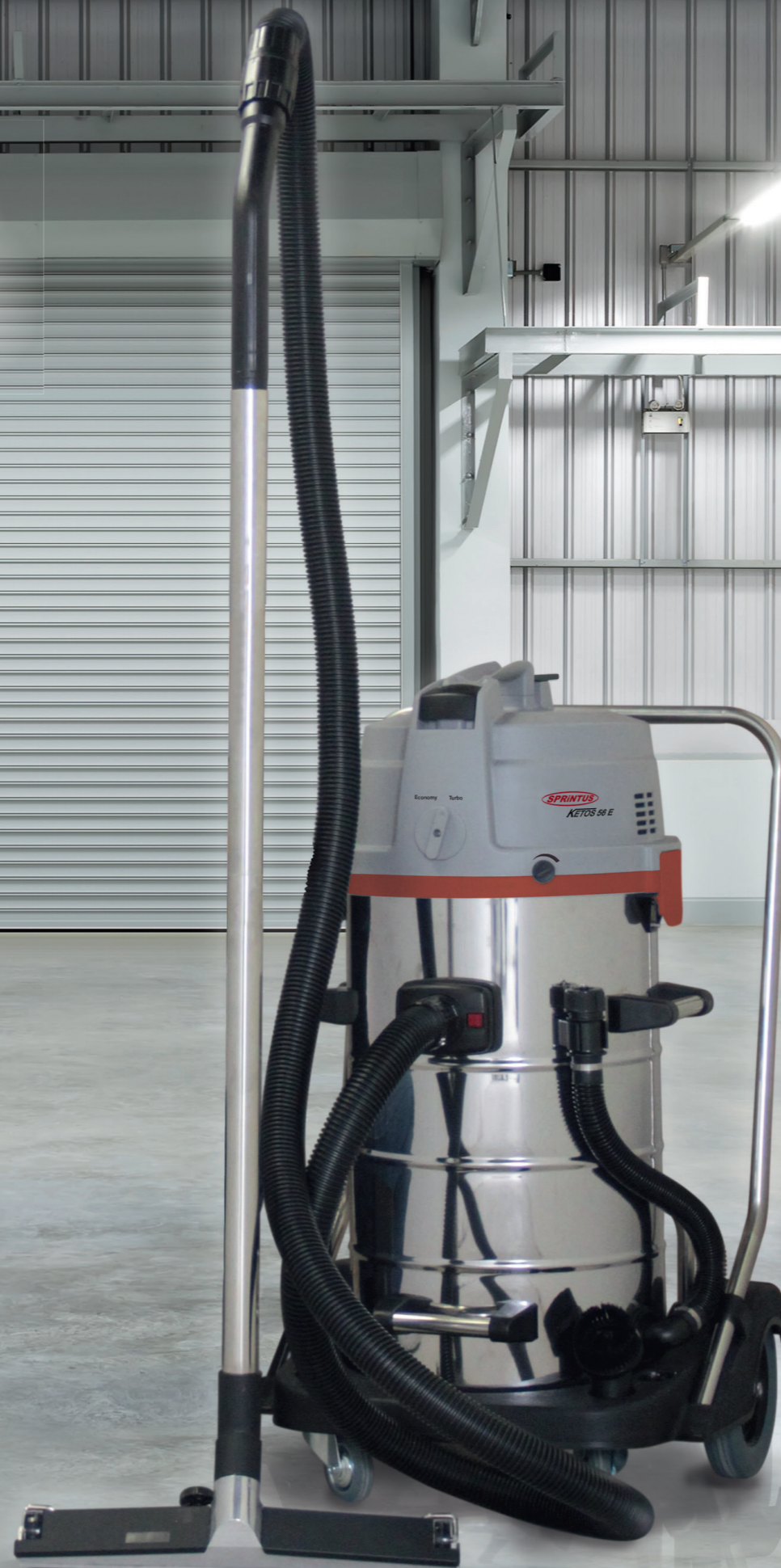
Abb. mit optionaler Metallbodendüse. Art.-Nr. 102.051