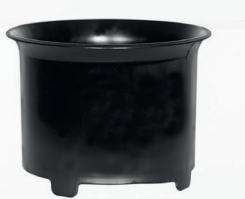
Serienmäßig: Zykloneinsatz Art.-Nr. 109.057