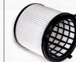
Serienmäßig: EPA12 Feinstaub-Filterpatrone Art.-Nr. 109.058