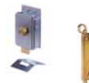
Sonstiges Zubehör Seite 179 – 181