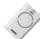
Funk und Handsender Seite 163 – 167