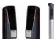
Lichtschranken und Alu-Säulen Seite 172 – 174